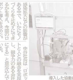
導入した協働ロボット

【船橋】中谷製作所（千葉県船橋市）は、協働ロボットを導入し、バリ取り作業を自動化して、安定生産とスピード向上を実現した。協働ロボットは、バリ取り作業を自動化し、安定生産とスピード向上を実現した。協働ロボットは、バリ取り作業を自動化し、安定生産とスピード向上を実現した。 協働ロボットは、バリ取り作業を自動化し、安定生産とスピード向上を実現した。協働ロボットは、バリ取り作業を自動化し、安定生産とスピード向上を実現した。協働ロボットは、バリ取り作業を自動化し、安定生産とスピード向上を実現した。